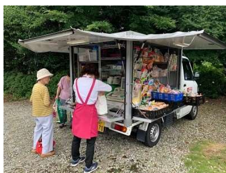
※山口県での移動販売の様子

当社は、山間部などにお住まいで実店舗へのご来店が難しい方が、“実際に商品を手にとって選び、気軽に楽しくお買物をしていただきたい”“移動販売を通じて地域のコミュニケーションの場を提供したい”との思いから、2013年より移動販売事業を行っております。現在山口県・広島県・兵庫県にて計12台の移動販売専用車を走らせ、約350か所にて地域の皆さまにご愛顧いただいております。今後も地域ごとのお客さまの生活に合わせた販売方法を目指し、日々運用をしております。