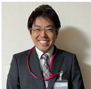
マックスバリュ宍粟一宮店