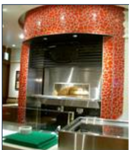
石窯(※イメージ画像)