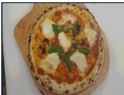
ピザマルゲリータ